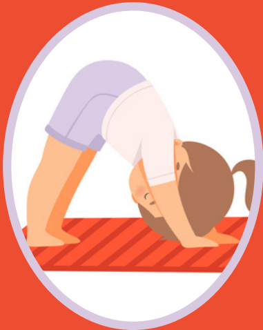
Adho Mukha Svanasana