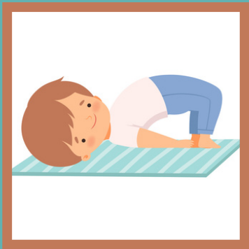
Ardha Setu Bandhasana